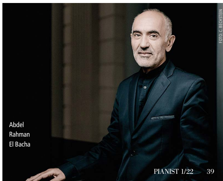
Abdel Rahman El Bacha